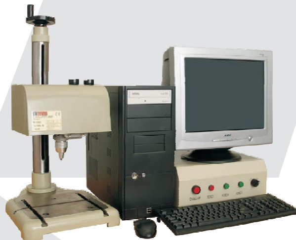
Настольная модель EL1 на держателе с индивидуальным управлением